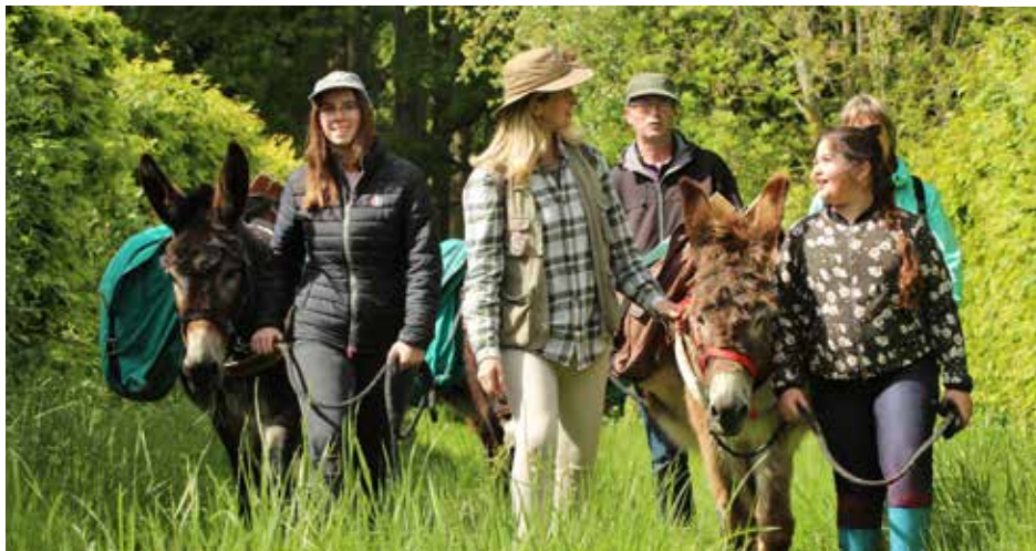
Le CENH, c'est l'école en pleine nature !