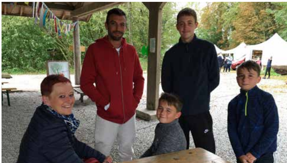
Le CENH, c'est d'abord un lieu de camaraderie !

1- Nous avons connu le CENH lors de sa construction il y a plus de 20 ans. Nous participions à un atelier de fabrication de briques en terre crue.