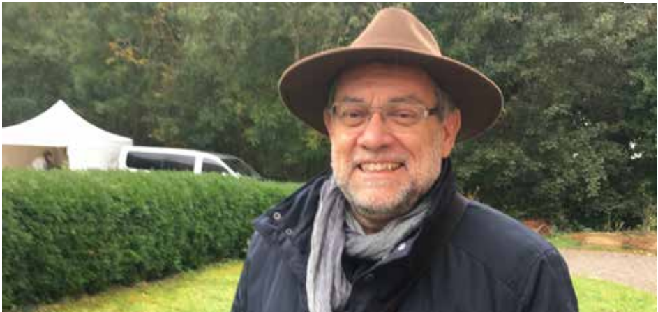
Le CENH, c'est un lieu d'éducation à la nature...