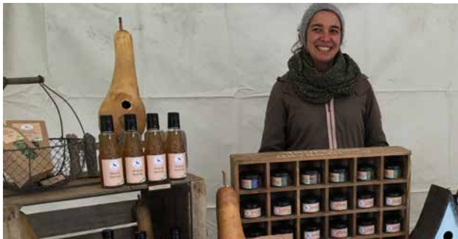
Le CENH, c'est un lieu naturel d'apprentissage !

1- Il y a quatre ans, une voisine m'a dit que le CENH recherchait une animatrice saisonnière. J'ai postulé et on m'a embauchée. Maintenant je suis artisan, très heureuse de participer aux 20 ans de l'association.