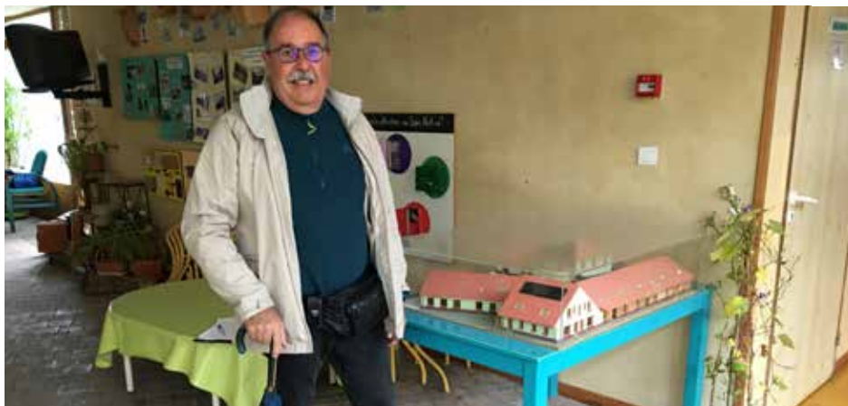
Le CENH, c'est un centre d'idées pour bien vivre