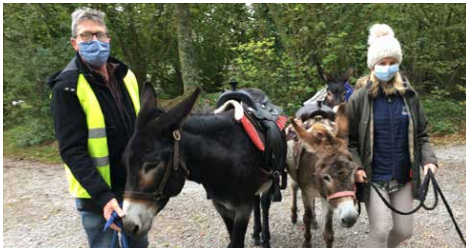
Le CENH, c'est la pédagogie de l'environnement