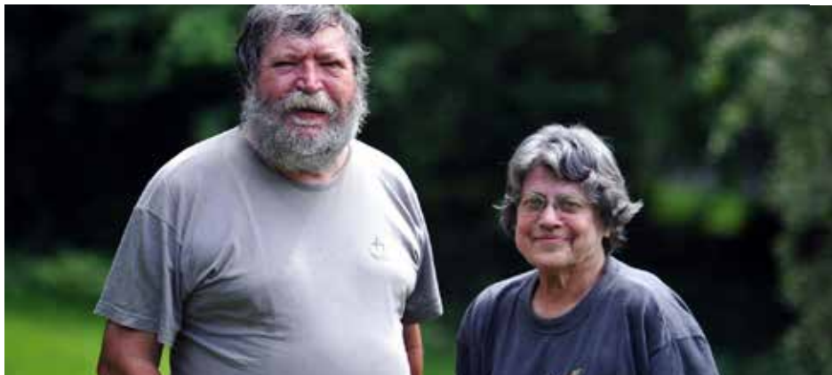
Le CENH, c'est un paquet de graines !

1- C'était au siècle passé ! L'agence de l'environnement, le Conseil Régional et des associations unissent leurs compétences. Ils vont même développer un fonds régional pour la maîtrise de l'énergie et seront source d'une approche renouvelée de la sauvegarde du vivant : la trame verte, vision dynamique de la biodiversité avec les corridors biologiques et les coeurs de nature ; notions qui ont essaimé partout et se sont enrichies de nombreuses contributions. Le CENH a même organisé des rencontres entre universitaires Français et Allemands !