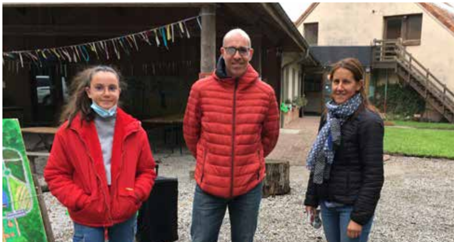
Le CENH, c'est le respect de la Nature !

1- Nous avons connu le CENH il y a 10 ans par l'école des enfants et les centres de loisirs, mais aussi via les associations qui utilisent l'équipement.