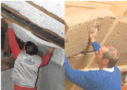
Mesurer les surfaces isolées...