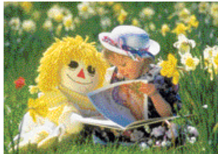
Mesurer les actions éducatives en environnement...