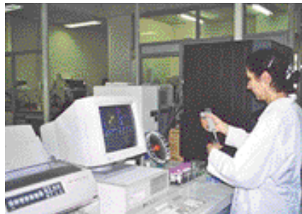
Mesurer la qualité de l'eau...