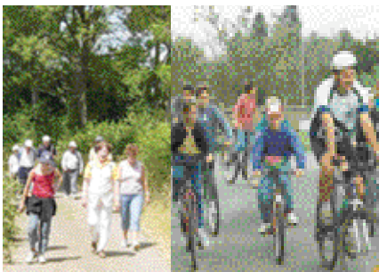
Mesurer les linéaires de randonnées...