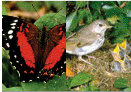
Mesurer les espèces protégées...