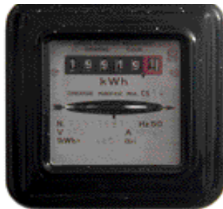
Mesurer les consommations électriques...