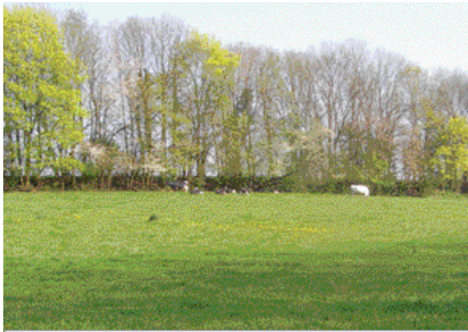
Mesurer les surfaces boisées...